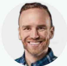
Liikunta-,urheilu- ja nuorisoministeri

Jos urheilusta tehdään ideologisten kamppailujen näytämö, vaarana on, että se alkaa ennemmin jakaa kuin yhdistää. Siksi urheilijoita ei pidä painostaa osallistumaan poliittisiin tai ideologisiin kampanjoihin. Heillä tulee olla vapaus osallistua, tai olla osallistumatta. Se on todellista yhdenvertaisuutta. Suvaitaan se.